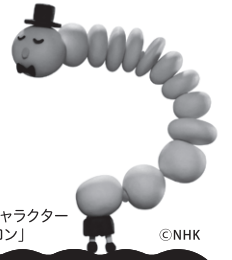
大腸のキャラクター 「コロロン」