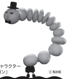
大腸のキャラクター 「コロロン」